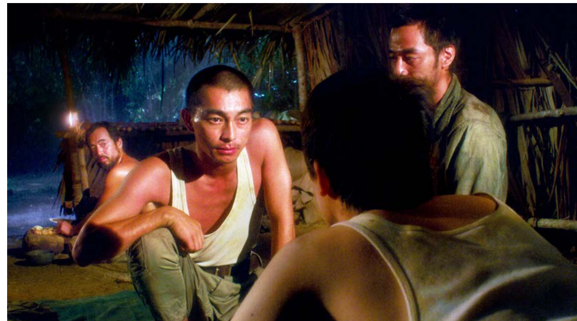
Entretien réalisé par Yannick Lemarié Extrait à paraître dans le numéro «d'été» de Positif

Rien n'est encore fixé... Je suis partagé entre la nécessité de parler de mon pays et celle de ne pas me raconter sinon à travers les autres. J'ai besoin de filmer mon époque, la France, sans pour autant m'y enfermer. En fait, avec Onoda , je me suis rendu compte que j'ai pris goût aux histoires difficiles voire impossibles à raconter. J'aime ce défi, cette aventure qui consiste à trouver une forme narrative, esthétique et poétique à des sujets vertigineux. Voilà ma certitude actuelle !